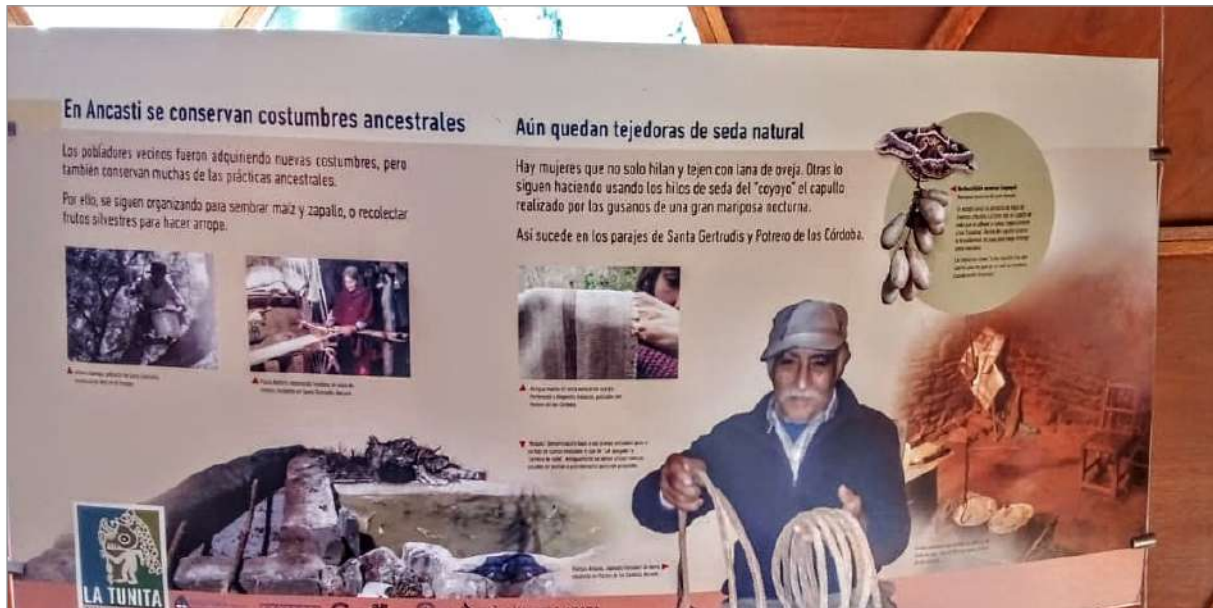
Figura 6. Cartel coyoyo La Tunita.