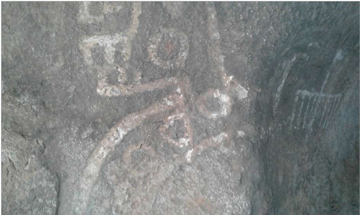
Figura 2. Jaguar pintado en La Tunita.

Las Casas de Piedra, como dicen lxs vecinxs, o La Tunita, como los arqueólogos dieron a conocer este lugar en las Sierras de Ancasti, se encuentran habitadas por seres que conviven en el presente con la comunidad local, los turistas, visitantes e investigadores. Estos seres pintados en las piedras nos llevan hacia otros tiempos, nos conectan con otras maneras de ser, de vivir y de relacionarse entre humanos e inhumanos. Las huellas de poblaciones que, en el pasado, crearon una transformación total en el paisaje, están por todas partes. Innumerables cañadas con andenería de piedras que generan espacios fértiles aparecen mientras subimos y bajamos lomas, transitando por los caminos y senderos serranos. El pasado convive con el presente, en las cuevas, en el bosque, en cada recorrido por el paisaje vivido (Fernández, 2023) (Figuras 2 y 3).