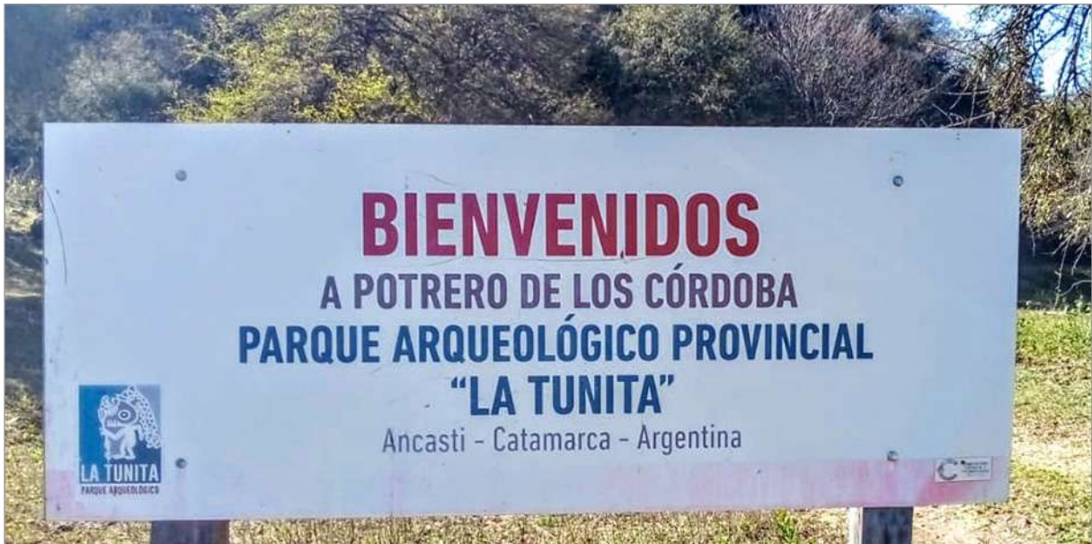
Figura 4. Cartel de entrada al Parque La Tunita.

Como dijimos anteriormente, el estado provincial se involucra en el establecimiento de un área arqueológica protegida con un acceso regulado, y en asociación con la ONG Fundación de Historia Natural Félix de Azara, se interviene en la instalación de cartelera y centros de interpretación en proximidades de los sitios (Figuras 4, 5 y 6).