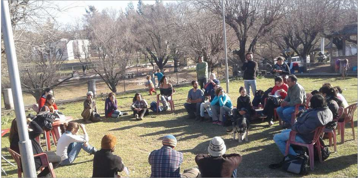
Figura 9. Asamblea de Ancasti por la Vida con el intendente, dando explicaciones (2017).

de la defensa territorial. En este proceso se vincula la arqueología indisciplinada que, dejándose llevar por las conversaciones locales, sale de la prisión espaciotemporal, rompe con el tiempo vectorial y propone (en asamblea) un contratiempo (Figuras 9 y 10).