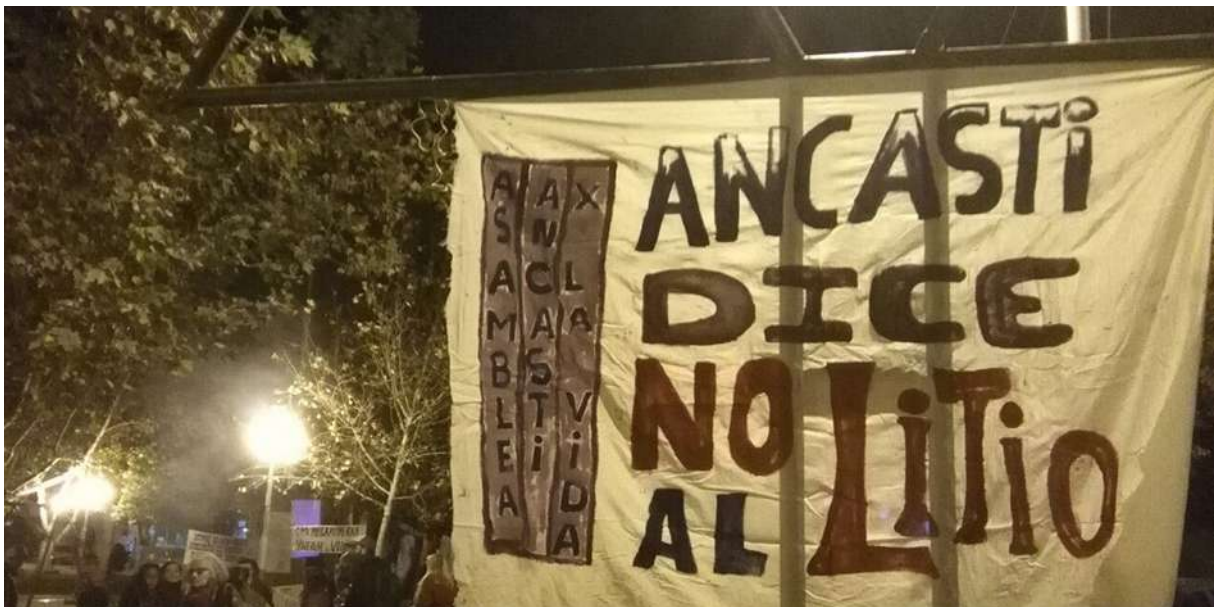
Figura 10. Bandera de la Asamblea en encuentro de asambleas (2017).