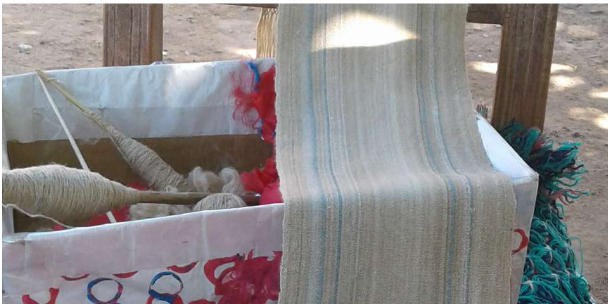
Figura 8. Tejido de coyoyo o seda silvestre.