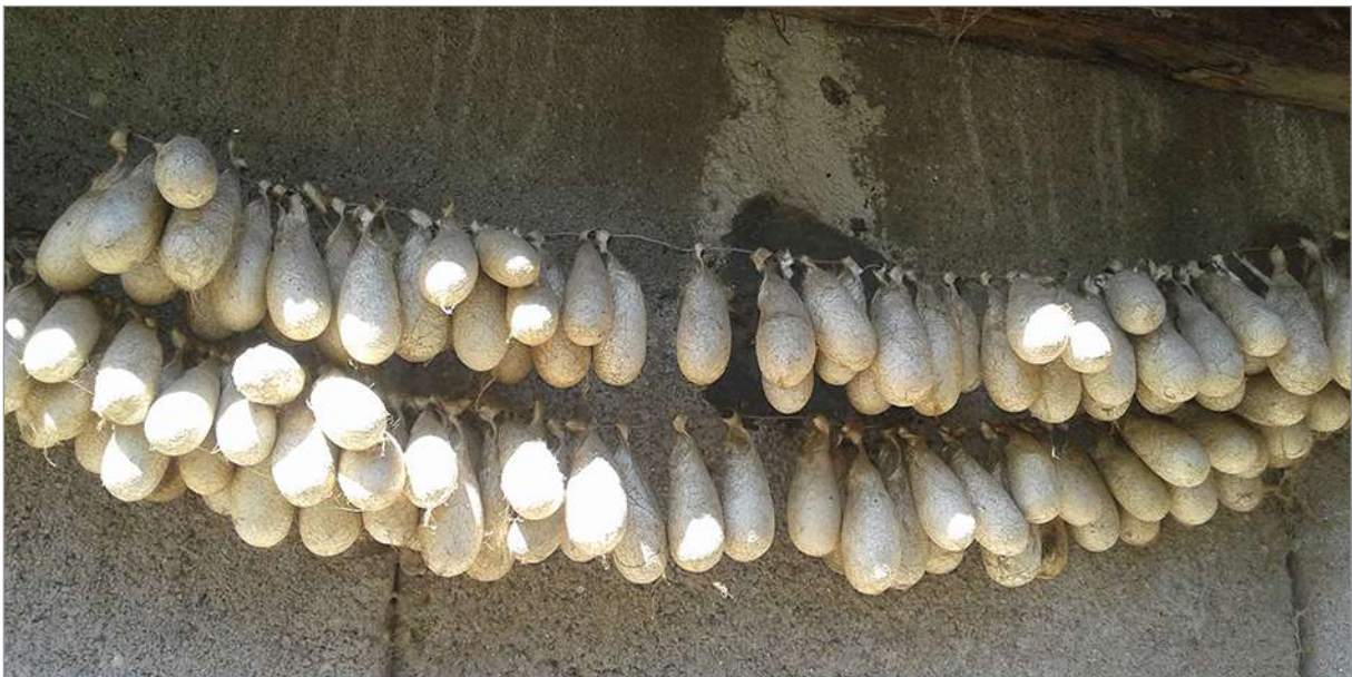
Figura 7. Capullos de coyoyo.