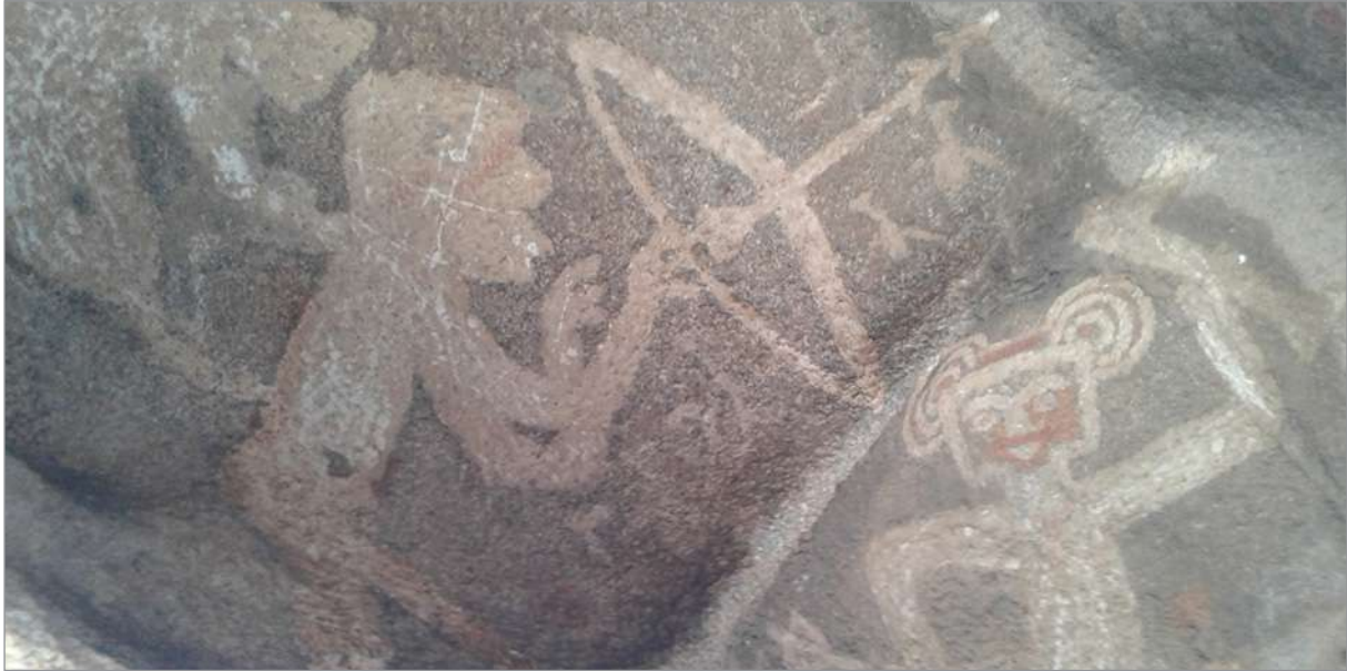
Figura 3. Chamanes pintados en La Tunita.