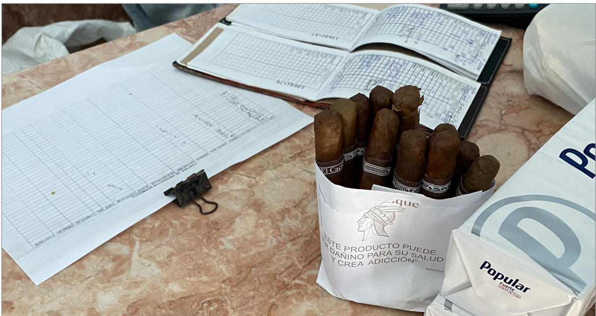
Figura 5. Sacando los mandados, 2023.