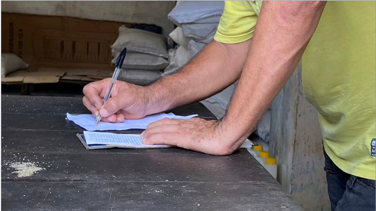
Figura 4. El bodeguero, 2022.

estarían “en contra del socialismo” y fomentaban la “especulación y el ocultismo” de mercancías. Cuando Valeria Gutiérrez intervino para exigir que dejara de hablarse de “política” no se había producido un consenso. Cada participante defendía su propia situación de realidad, mezclando vivencias personales con los relatos históricos oficializados, en disputa por la verdad.