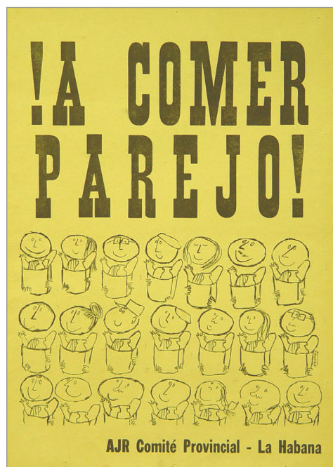
Figura 3. Propaganda a favor de la libreta por la Asociación de Jóvenes de Rebeldes en 1962. Recuperada por la Biblioteca Nacional de Cuba.

En adición, Díaz (2010) advirtió sobre esta misma época el nexo de la libreta con la construcción del “hombre nuevo” del Che Guevara (2016[1965]), entendido desde este ámbito como aquella persona revolucionaria que se conforma con las cuotas mensuales, en oposición al consumismo capitalista. Otros autores, como (Muñiz y Vega 2004:14), señalaron la aspiración estatal de que el comercio interior fuera asumido con un criterio “científico-político”. Ambas retóricas cedieron ante la crisis económica del llamado Periodo Especial, en la década de 1990. Desde entonces, la vinculación de la libreta al socialismo varió de un carácter constructivista de la sociedad y la persona al de objeto